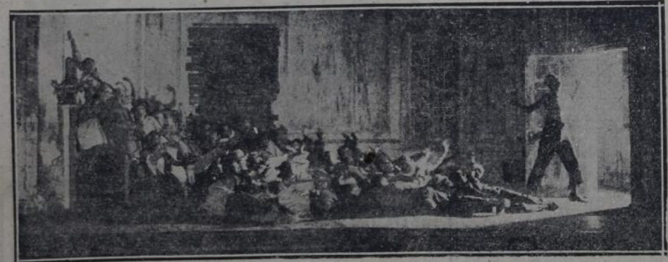
UNA ESCENA DE "PORGY". — (El espanto ante el anuncio de la tormenta).

Norte América parece ser actualmente un lugar propicio para el desarrollo del arte escénico. Algunos de sus autores, como Eugene O'Neill, han conquistado una fama mundial, siendo sus obras conocidas en los escenarios de las grandes capitales europeas.