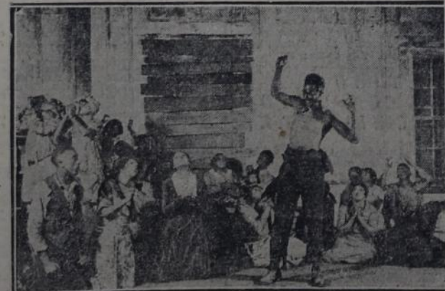
OTRA ESCENA DE LA MISMA OBRA

Los críticos norteamericanos hicieron justicia al espíritu de inventiva y a la noción de la realidad de esta arte incipiente.